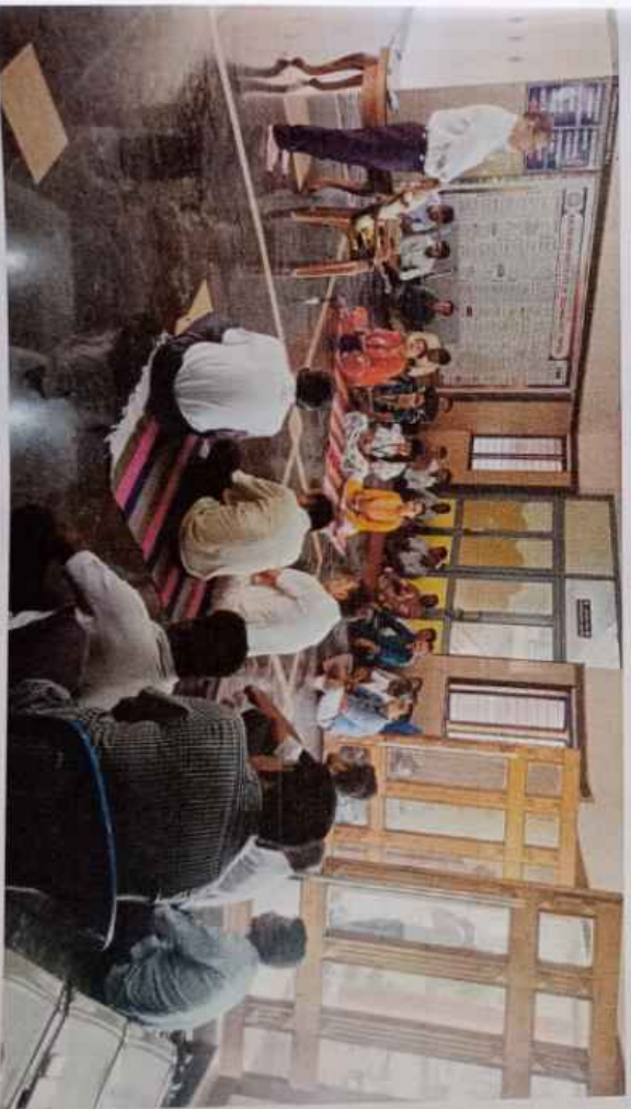
On 02-10-2022, Rashtra Pitru Mahatma Gandhi Jayanti and Lalbahadur Shastri Ji Jayanti