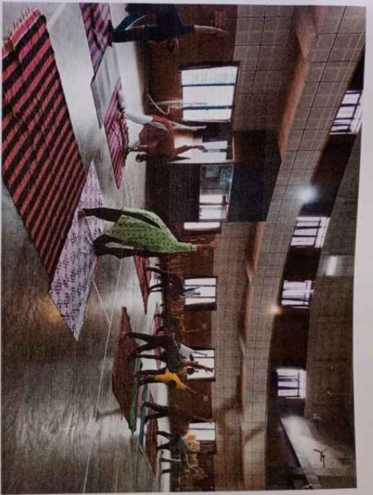
INTERNATIONAL YOGA DAY 2022 21-06-2022